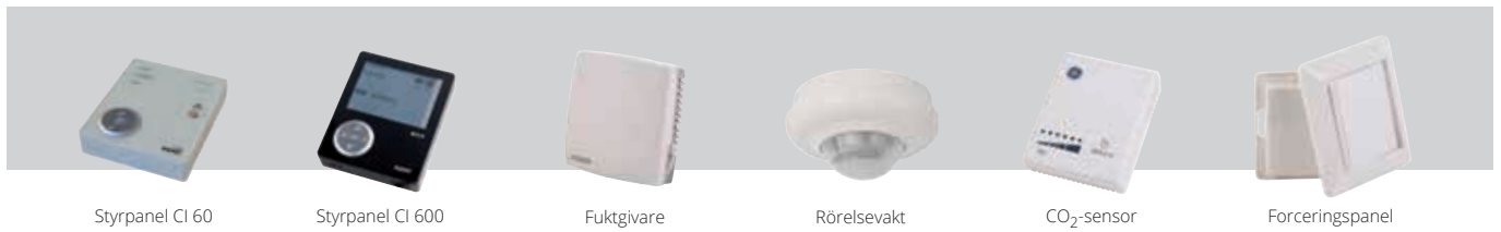
Styrpanel CI 60